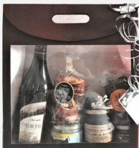
Colis simple ou double (photo)